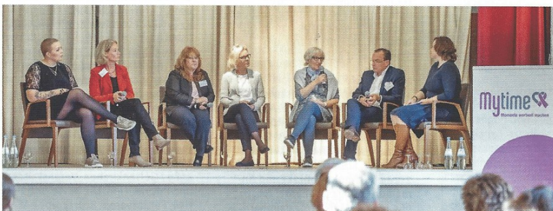
Podiumsdiskussion über metastasierten Brustkrebs

Die Termine 2018 werden auf diesen Kanälen kommuniziert.