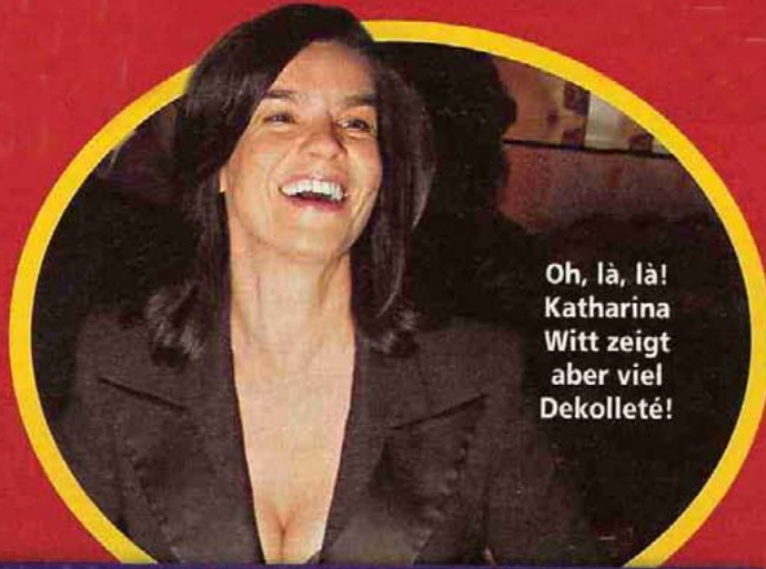
Oh, là, là! Katharina Witt zeigt aber viel Dekolleté!

Mit schwingenden Hüften stolzierten Fernsehstars bei einer Charity-Modenschau in Berlin über den Laufsteg. Die Kasse klingelte, denn Kleider können Frauen ja nie genug haben! Mit von der Partie waren die Schauspielerinnen Alexandra Kamp (40) und Saskia Valencia (42) sowie die Moderatorin Barbara Schöneberger (33) . Der Erlös dieser Aktion kommt dem Verein „Brustkrebs Deutschland“ zugute. Dafür gab's einen dicken Applaus!