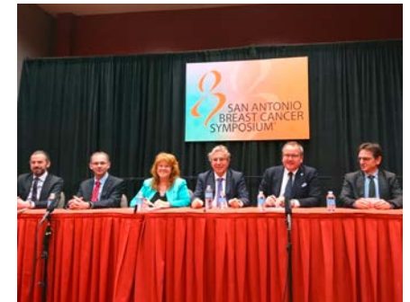
Round Table auf dem San Antonio Breast Symposium (2016)