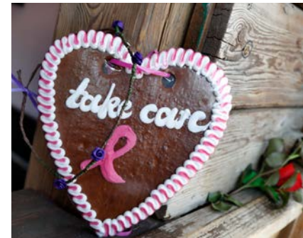
Estée Lauder Companies GmbH