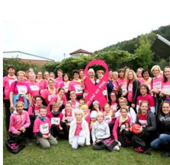
Bad Brückenu Charity-Lauf „Gemeinsam sind wir pink“