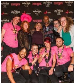
Pinktober im Hard Rock Cafe Berlin

Die Perückensammelaktion für bedürftige Frauen in Südeuropa läuft seit 2015 sehr erfolgreich. Jährlich werden mehrere hundert Perücken nach Griechenland, Portugal oder Mallorca versandt. Zuletzt waren es mehr als 450. Weitere Länder werden folgen.