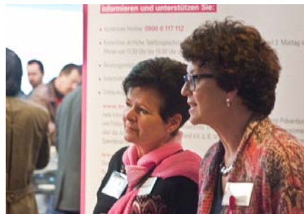
Ehrenamtliche Helferinnen auf dem jährlich stattfindenden Wintersymposium in München