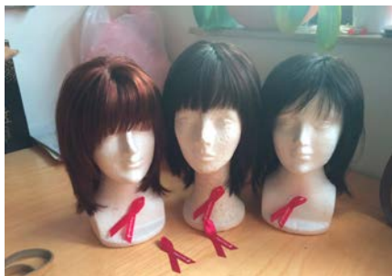
Perücken aus der Sammelaktion „Perücken für Griechenland“