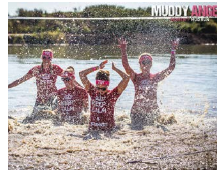
Muddy Angel Run

Insgesamt werden jedes Jahr mehr als 250.000 Flyer und Broschüren verteilt!