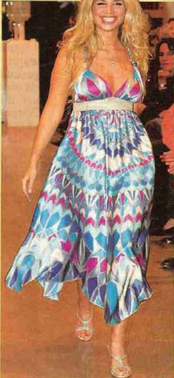
„GZSZ“-Star Susan Sideropoulos im Neckholderkleid von Tashia London

Schauspielerin Doreen Jacobi auf dem Catwalk ihre Traumfigur. Im aktuellen „Playboy“ ist die hübsche Potsdamerin wesentlich spärlicher bekleidet nur in sexy Dessous zu sehen. Ganz anders im nächsten „Tatort“ aus Leipzig (1.4., 20.15 Uhr, ARD). Da spielt die 33-Jährige eine strenge Anwältin, die Kommissar Ehrlicher ( Peter Sodann ) das Leben schwer macht. Neben ihren TV-Jobs leitet die zarte Blonde eine Software-Firma. Wie sie alles schafft? „Mit Organisation und Disziplin“, erklärt Doreen.