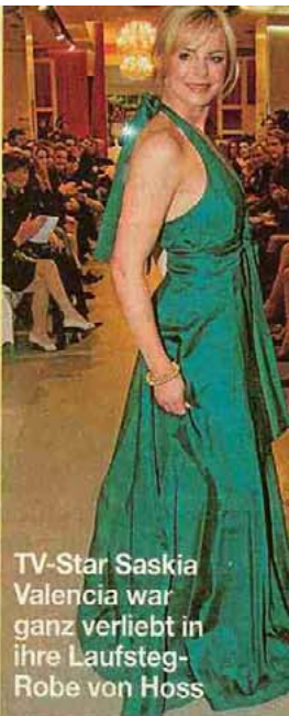
TV-Star Saskia Valencia war ganz verliebt in ihre Laufsteg-Robe von Hoss