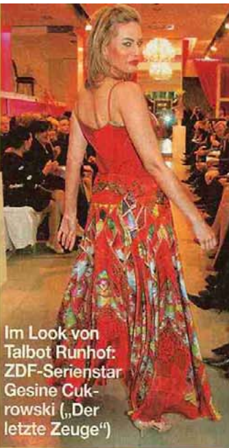
Im Look von Talbot Runhof: ZDF-Serienstar Gesine Cukrowski („Der letzte Zeuge“)